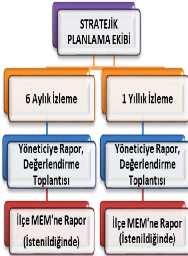
Şekil 8: Stratejik Plan İzleme ve Değerlendirme Modeli